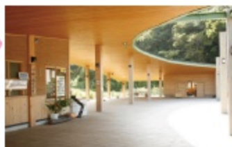
A 三舟の里 案内所