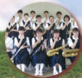
千葉県立君津商業高等学校 吹奏楽