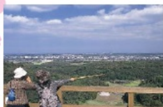
B 三舟山 山頂 合戦の陣跡