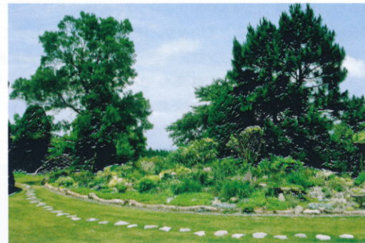
淡路花博記念庭園