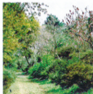
マグノリアの小径