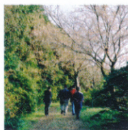
ヤマザクラの尾根道