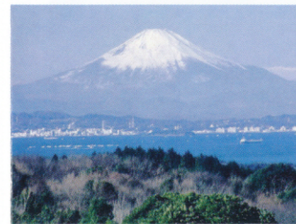
望京の丘から望む富士山