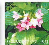
ハコネヒキソウ 5月