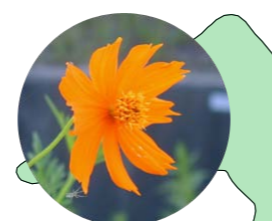
キバナコスモス (7~8月)