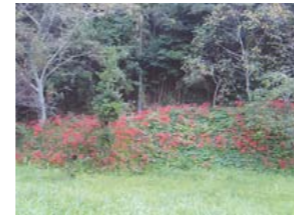
南養院の曼珠沙華