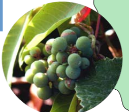
ヤマブドウの実 (7~8月)