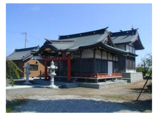
春日神社 天延2年(974)創建