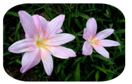
サフランモドキ (6~9月)