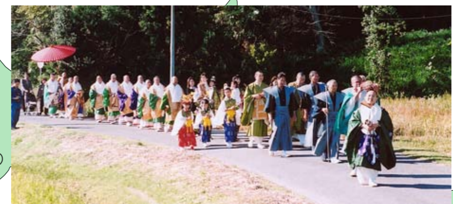
正福寺 晋山式稚児行列