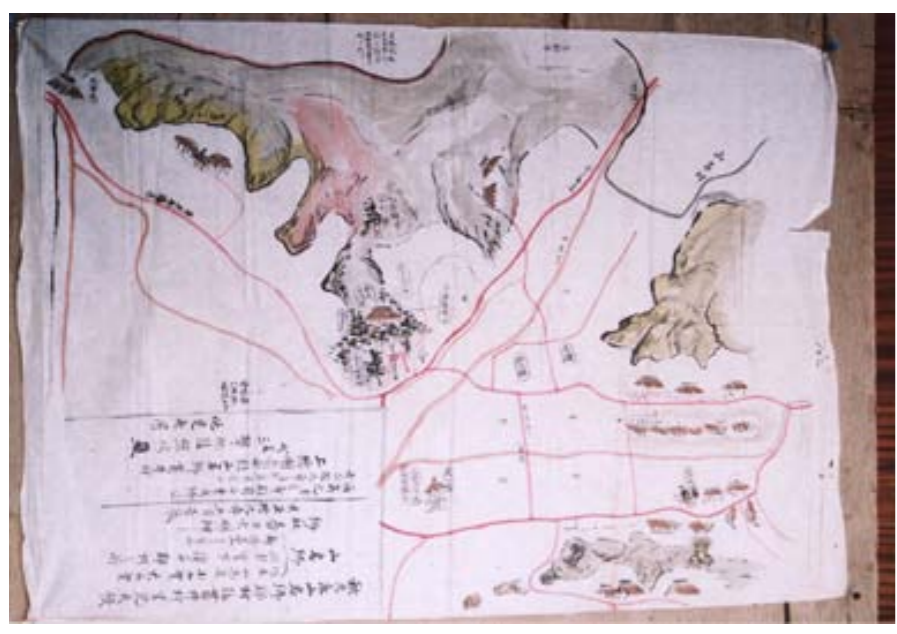
古絵図 天正19年 (1592年)