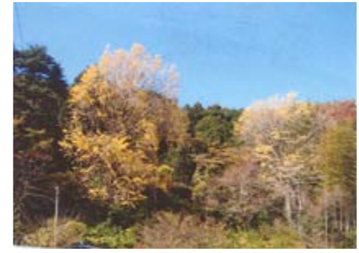
南養院の大イチョウ