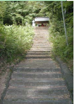
地福寺 雨乞い地蔵 三幣十郎兵衛政次墓