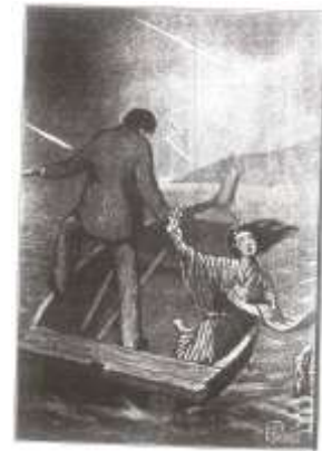
図-2 『海堡技師』序の幕の挿絵（国立国会図書館蔵）

につげる。玄道は毒を入れた急須を投げ込み、お杉に石を結びつける。お杉は富津の海に沈む。