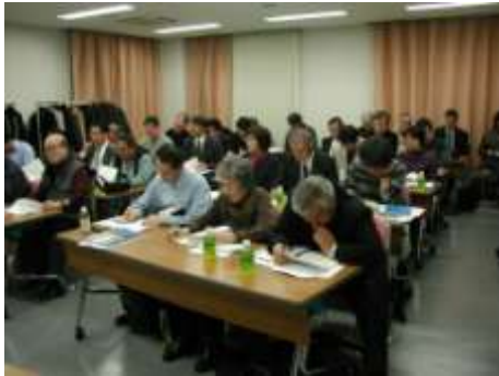
シンポジウム風景