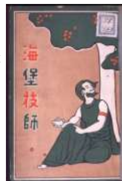
図-1 『海堡技師』の表紙 (国立国会図書館蔵) 〔手に持っているのは急須。〕