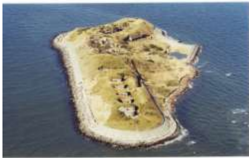
第一海堡 (2000年2月)