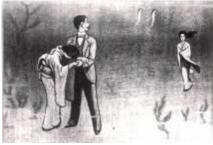
図-4 『海堡技師』 詰の幕の挿絵 (国立国会図書館蔵) [若い姿の玄道、お花、お杉]

る。海堡が波で壊れてしまったことも海底での二人の争いも夢であった。玄道は海をみて、「あの海堡は伊豆の山を二つ砕いて生まれたものだ。30年来毎日行って育てた愛しい子だ。自分が死んだ後は三つの霊火(タビ)が夜ごとに燃えるだろう。」という。