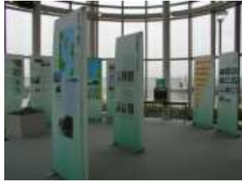
東京湾口航路工事事務所内 第三海堡展示室