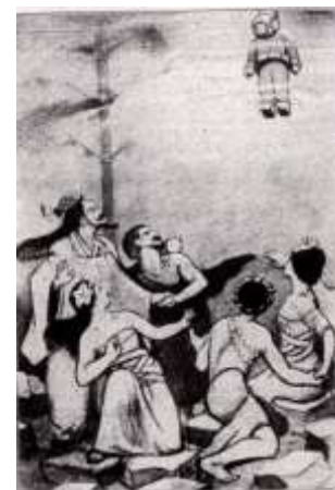
図-3 『海堡技師』中の幕の挿絵