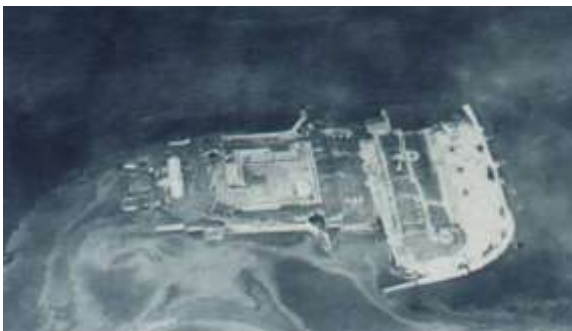
震災直後の第三海堡の写真

現地調査結果とその写真から得られる情報を重ね合わせ、どのように崩壊していったのか、東京湾口航路工事事務所で継続で解析しているところだ。