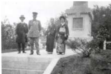
写真-1 西田明則君之碑 写真-2 西田明則君之碑竣工式での遺族 大正12年(1923)4月22日【右から二人目が小坂いゑ】