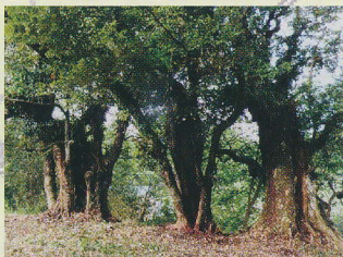
椎の木 大木 (樹齢200年位)