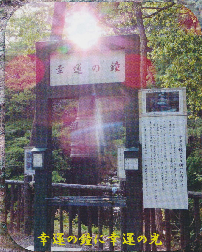
幸運の鐘に幸運の光