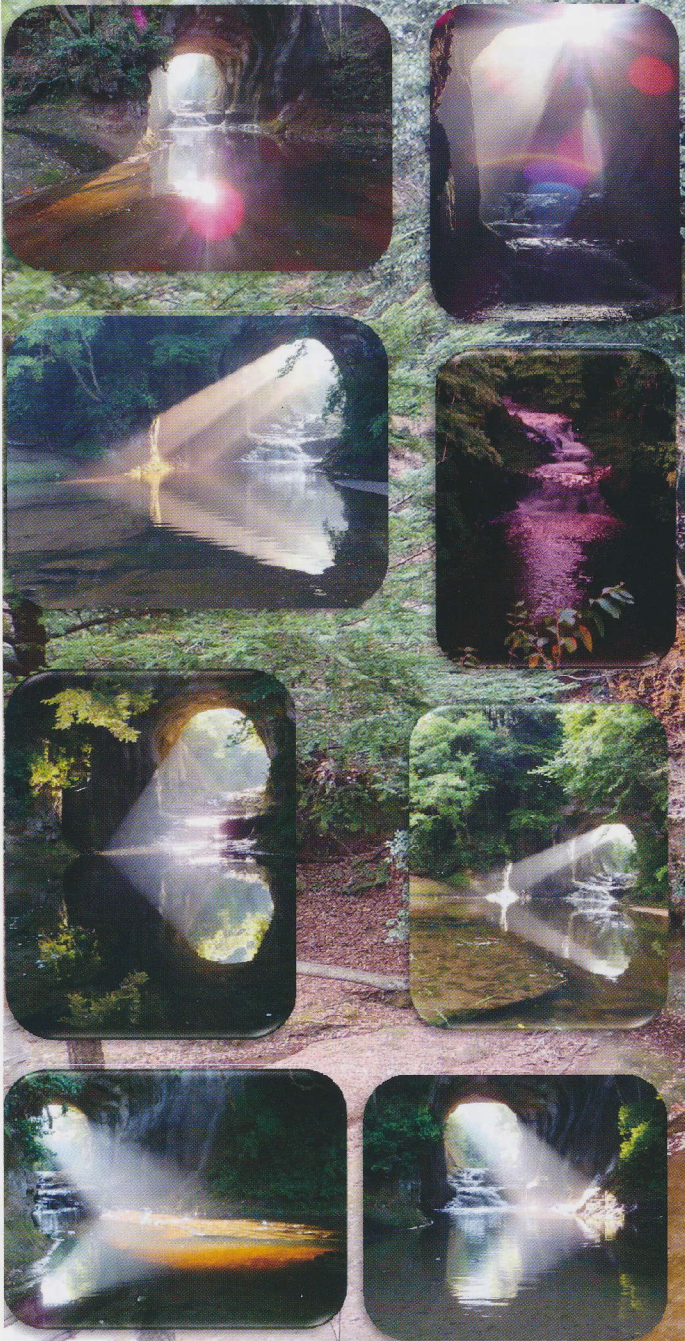
小櫃川支流片倉ダム清水溪流広場地先