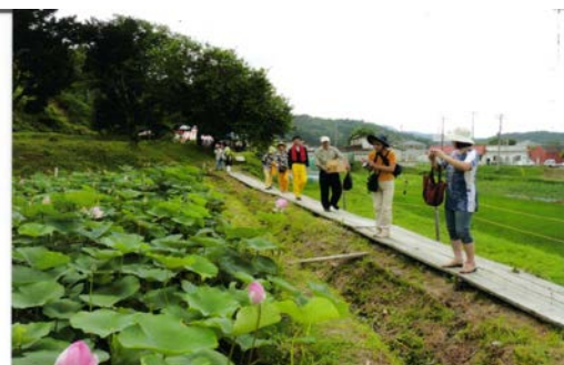
「大賀蓮」メイト募集