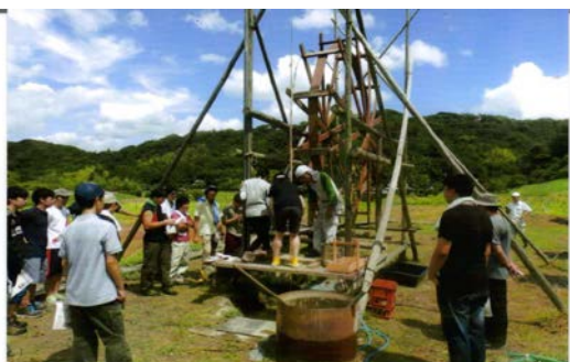
「上総掘り」メイト募集

地域資源を活用し、周辺地域の活性化と発展に尽力し、併せて魅力ある地域社会の創造に寄与することを目的とする。と定款にうたっており、具体的には、久留里城を南側から見上げる一帯の景色を「城山郷」（じょうざんきょう）と名付け、不耕作の棚田をお借りして、大賀蓮、菖蒲、曼珠沙華等の花や桜、紅葉、ミツバツツジを植え、時期には多くの方に楽しんでもらっております。他にも「オオムラサキ」「かぶと虫」「ホンモロコ」の養殖にも取り組んでいます。また、この地域の伝統技術で国の民族無形文化財に指定されている「上総掘り」の実習を実施しています。小学生から大学生、一般の方も実習に訪れています。