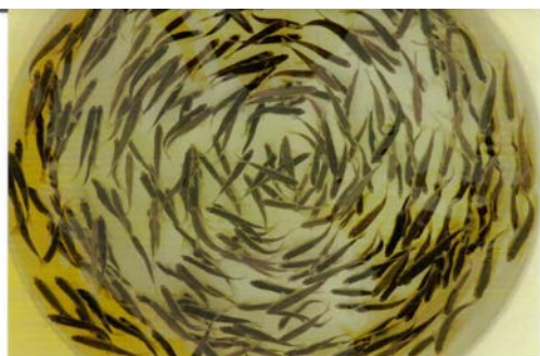
「ホンモロコ」メイト募