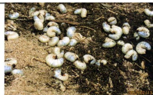
「かぶと虫」メイト募集