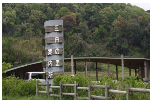
【三舟の里案内所来訪者】