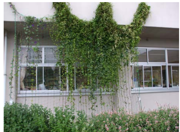
貞元小学校のおかわかめ

カーテンとして利用する場合は、成育した苗で風があまりあたらない場所で栽培する必要があるようです。