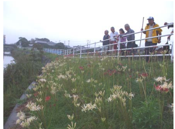
下流に向かって右側（中道橋そば）

右側にさらに植えることができれば、一段と見事なスポットになるので地元と協議をしながら拡充したいと考えています。