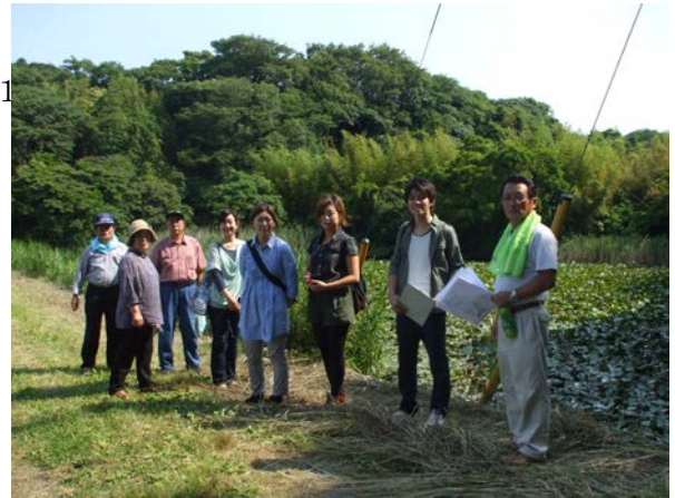
学生と現地調査 貞元の水蓮が咲くため池

今年度のメインテーマで、ワークショップ2回千葉大学による独自調査、役員による調査、そして大学と役員による合同調査等実施しました。