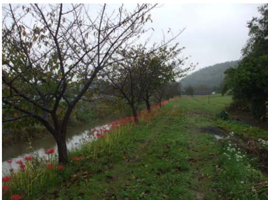
貞元橋から上流本道橋に向かって右側

9月25日、3年目とはとても思えないほど予想以上に咲いた、満開に近いヒガン花を見ることができました。