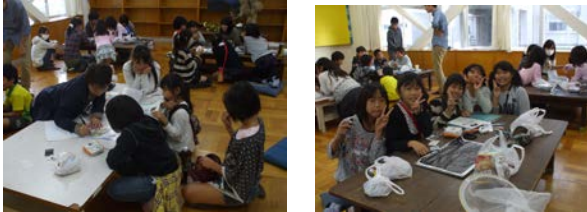
子どもたちのワークショップ