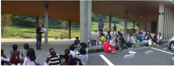
スペシャリストのお話