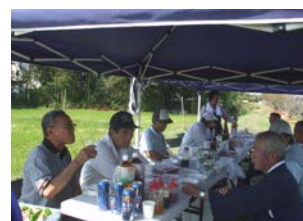
10・19 江川のヒガン花の手入れと懇親会