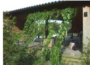
三舟の里の案内所