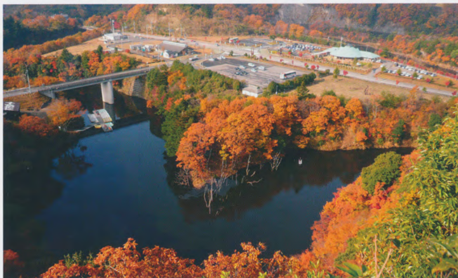
笹川湖展望台からの眺望（紅葉に包まれる道の駅）