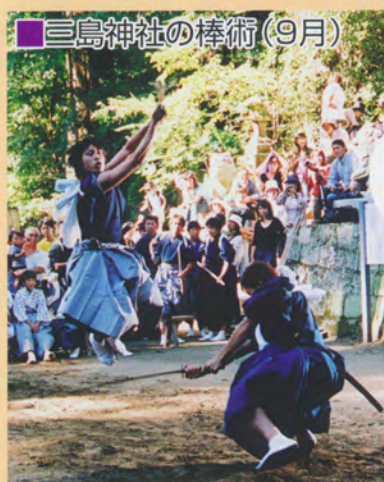
三島神社の棒術 (9月)