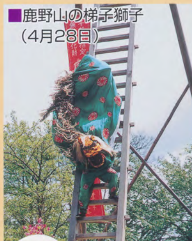
鹿野山の梯子獅子 (4月28日)